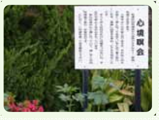
無心山の登り口に建てられています。