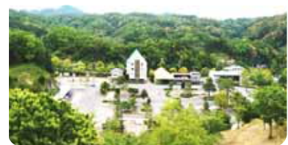
鮮やかな緑(青)が、眩しく溢れる中で「Mランドまつり」を待ちわびるMランド。(則)