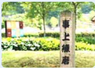
本館裏の庭に建つ「事上練磨」の木柱。