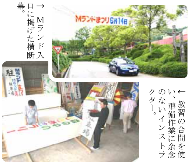
→Mランド入口に掲げた横断幕。

合宿で二週間だけの滞在でしたが、後から一番の参加者だと聞いて驚いていますが、とても光栄に感じております。MDSでは三種の神器(お茶席、トイレ掃除、ハガキを書く)を教えていただきました。トイレ掃除をするとお金持ちになるそうなので、今でも続けております。