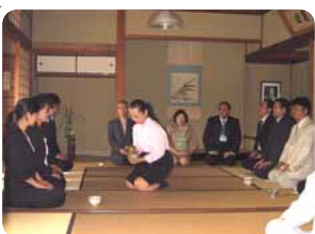
小河会長宅の庭園鑑賞、そしてお茶を差し上げ、伝統的日本文化を味わっていただきました。

人間力を高めるため、人に関心をもち、そして人のために行動する、Mランドの志」を肌で感じる事ができた、益田講座となりました。