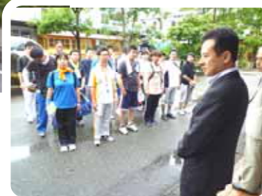
出発式で激励の言葉を述べられた福原市長さん(前)。