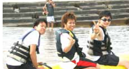
「こんな楽しいイベントが待っているなんて思いもよらなかった。」バナナボートに乗り、気分最高のゲスト三人組。