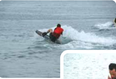
マリンスポーツ協会の人がいねいに指導してくれました。