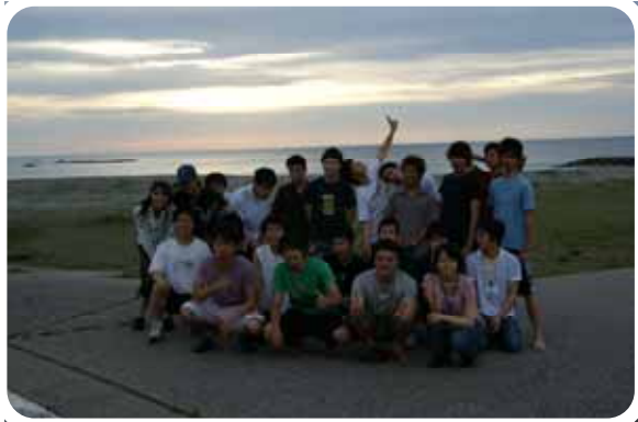
日本海に沈む夕日を背に思い出の一枚。

十八名チャレンジ、完歩者六名、最短完歩時間二十三時間、初めてのチャレンジは終わりました。来年から、「益田百キロメートルウォーク」