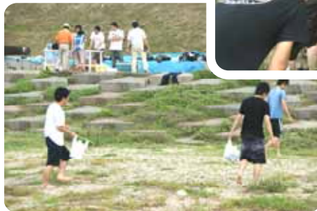
初めての飯ごう炊飯、「うまく炊けるかな?」飯ごうの中には、清流日本一の高津川の鮎も入っています。