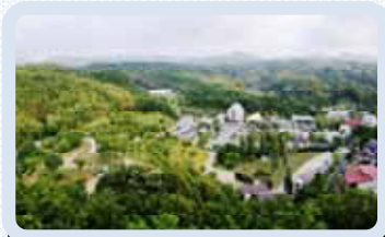
マイナスイオンが充満した「いやしろ地」Mランド。