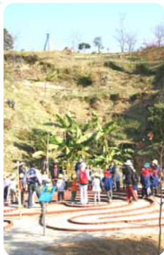
無心山の下にある「これぞ迷路」で楽しむ園児たち