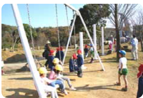
無心山にあるブランコで気分も爽快。

そして、生きる勇気と希望を持ち、このMランドに何度も帰ってきたい、そう思える「ソウルメイト(魂の友)」の集う場となるよう、今後も取り組んでいきます。