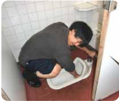
目を閉じ、便器に手を入れ磨く、手は目より勇気があるのかな？

そして、今回の研修の中心となったのが、「リーダー制」の導入でした。一人一役を与え、各自にリーダーとしての責任をもってもらい、その責