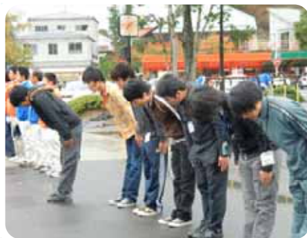
「やまびこ点呼」の訓練をしている 広工大専門学校の学生さんたち

任を果たすためにどうすればよいのかを、ポジティブに考え行動してもらいました。これらの取り組みに、十名の研修生は実に真剣に取り組んでいました。入校当初は、慣れない環境から戸惑いもあつたようですが、メンバー同士で助け合いながら、とてもよいクラスへと成長したようです。この研修に関わることができたMランド社員もたくさんの気づきと元気を貰いました。